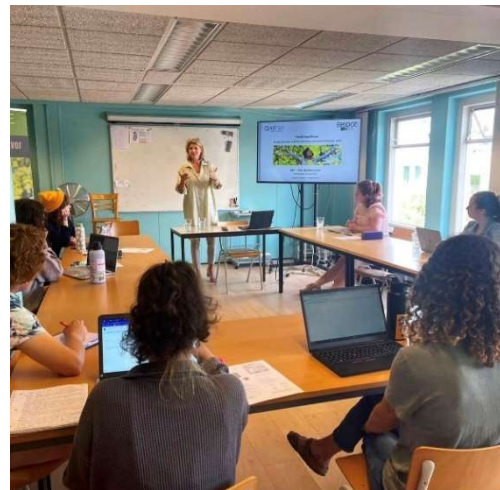
Gastles aan internationale studenten van SIT

SIT, School for International Training, biedt programma's aan die gericht zijn op het verbeteren van intercultureel begrip en leiderschapsvaardigheden aan internationale studenten die bij gastgezinnen verblijven en studies in het gastland kunnen volgen. Studenten met bijvoorbeeld een opleiding in sociologie, psychologie, vrouwenstudies, seksualiteit, gender of queerstudies nemen deel aan de discussie over getraumatiseerde slachtoffers van moderne slavernij en hoe zij kunnen transformeren naar overlevenden van mensenhandel en uitbuiting.