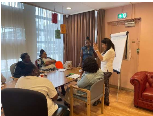
Social Skills workshop ter voorbereiding op bezoek aan een restaurant of bioscoop

Nadat fases van stabilisatie en rehabilitatie vorderen en de overlevenden het vertrouwen in zichzelf en de mensen om hen weer terugkrijgen, zie je soms dat deelnemers zich gaan beroepen op traditionele gewoontes en hechten aan culturele gebruiken uit het land van herkomst. Dit kan onder andere te maken hebben met ideeën over senioriteit en hiërarchie. Dingen die we in Nederland niet gebruikelijk vinden en wat kan zorgen voor onbegrip en irritatie over en weer tussen deelnemers en begeleiders. Aandacht voor achtergrond en cultuur is nodig voor vrijwilligers (die ook een heel diverse achtergrond hebben) en voor deelnemers om hen te begeleiden naar een zelfstandig bestaan in Nederland. Daartoe worden ook lessen sociale vaardigheden gegeven die worden besloten met bijvoorbeeld een bezoek aan een restaurant of een bioscoop. Iets wat de deelnemers nog nooit meegemaakt hebben. Bijvoorbeeld dat het gebruikelijk is om met mes en vork te eten, of dat je wellicht in de rij moet staan om een kaartje te kopen, dat iedereen op z'n beurt wacht en dat je stil bent als je naar een film kijkt. Deze social skills workshops blijken zeer effectief en worden zeer hoog gewaardeerd door de deelnemers. Weten hoe het er aan toe gaat in dit land en weten hoe het hoort. En ook ter voorkoming dat mensen in hun "eigen bubbel" blijven hangen en actief gaan participeren en integreren in de Nederlandse samenleving.