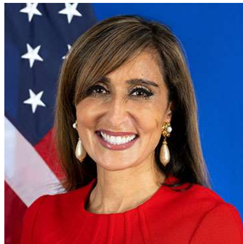
H.E. Shefali Razdan Duggal, Ambassador of the United States of America to the Netherlands

Dit was het thema waar de Amerikaanse Ambassadeur Shefali Razdan Duggal over sprak tijdens een bijeenkomst georganiseerd op Webster University in Leiden in mei 2023. In een persoonlijk verhaal vertelde Razdan Duggal over de samenwerking tussen de Verenigde Staten en Nederland met betrekking tot mensenrechten, over rekening houden met de geschiedenis en erfenis van de trans-Atlantische slavenhandel en over vrouwenrechten in het buitenlandbeleid van de VS.