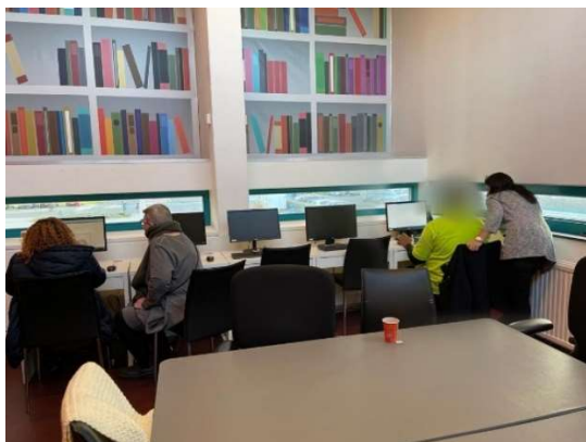
Leren hoe een computer aan en uit gaat in de computerruimte in Buurthuis de Bonte Kraai

Op het moment dat ze de basisvaardigheden beheersen, zoals bijvoorbeeld informatie zoeken via Google en een email kunnen sturen, ontvangen zij een laptop om zich verder te bekwamen in het gebruik van de mobiele telefoon en de computer. Het kunnen werken met twee apparaten, een laptop en een smartphone, is essentieel ter voorbereiding op re-integratie in de samenleving. Nog niet iedereen heeft een smartphone.