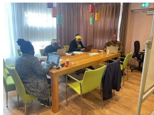
Leren werken met laptops in combinatie met smartphones