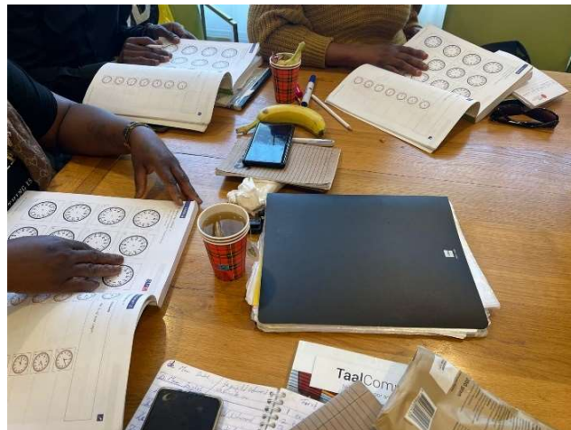
Test uit A1 boek Taal Compleet - klokkijken

De deelnemers geven zelf aan dat ze liever meer lessen hebben en dat ze liever niet te lange vakanties willen zoals gebruikelijk bij scholen of universiteiten.