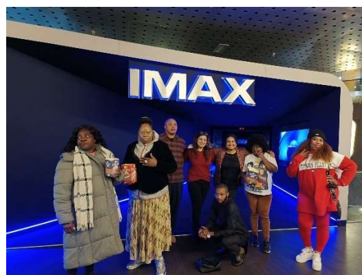
De eerste keer naar een bioscoop